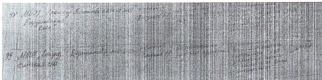
Журнал регистрации посещений